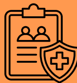
Don par assurance vie

Pensez au gens et aux causes que vous aimez! Simple, facile, accessible.