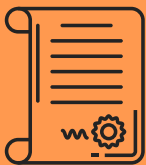
Don par testament

Planifiez un don lors de votre départ en mettant la Fondation bénéficiaire d'une partie de votre patrimoine. Vous marquerez l'histoire de votre hôpital! Vous soutiendrez aussi l'avenir des soins pour les prochaines générations. Planifier maintenant vous permet aussi de faire un don important tout en conservant votre sécurité financière.