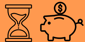
Don de REER/FERR

Vous êtes trop assuré? Avant d'annuler votre police d'assurance vie, pensez à la donner à votre hôpital.