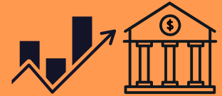
Don de titres cotés en bourse