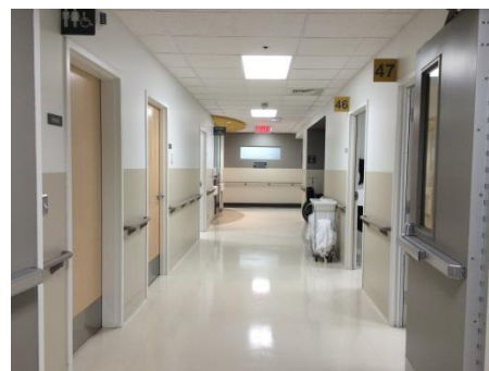
Vue des salles de consultation à l'Unité de médecine de jour, aménagé au coût de 3,3 M$.

Le premier projet de la campagne majeure a été livré à l'hôpital début décembre. Il s'agit du réaménagement de l'Unité de médecine de jour au 5 e étage de l'Hôtel-Dieu-de-Lévis. Ce réaménagement rend l'unité beaucoup plus fonctionnelle. La médecine de jour permet notamment la diminution du nombre de personnes hospitalisées, la réduction des coûts, le désengorgement de l'urgence et la prise en charge des patients atteints de maladies chroniques, en complément de la première ligne.